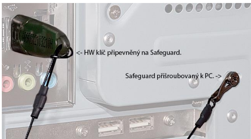
Safeguard připevněný k zadní části PC pomocí šroubku.

Velikost ocelového poutka odpovídá velikosti šroubků, které se používají ve většině PC.