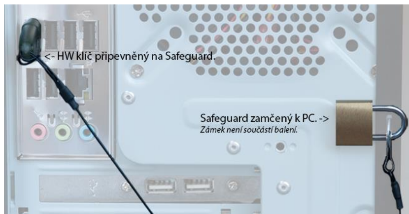
Safeguard připevněný zámkem k poutku na zadní straně PC.

Safeguard může být připevněný ke stolu nebo jiným přístrojům, se kterými nelze jednoduše manipulovat.